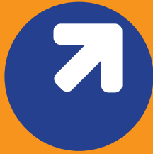
TABLE DES MATIÈRES